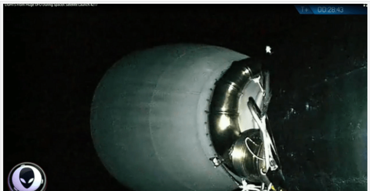
Gli oggetti ancora non entrano in scena