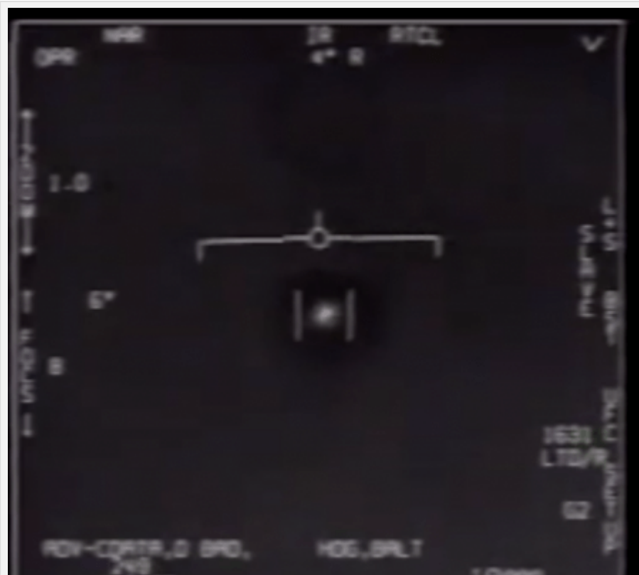
L'oggetto e' agganciato alla telecamera

Ritrovato video di caccia USA che intercettano un UFO: E' reale?...forse