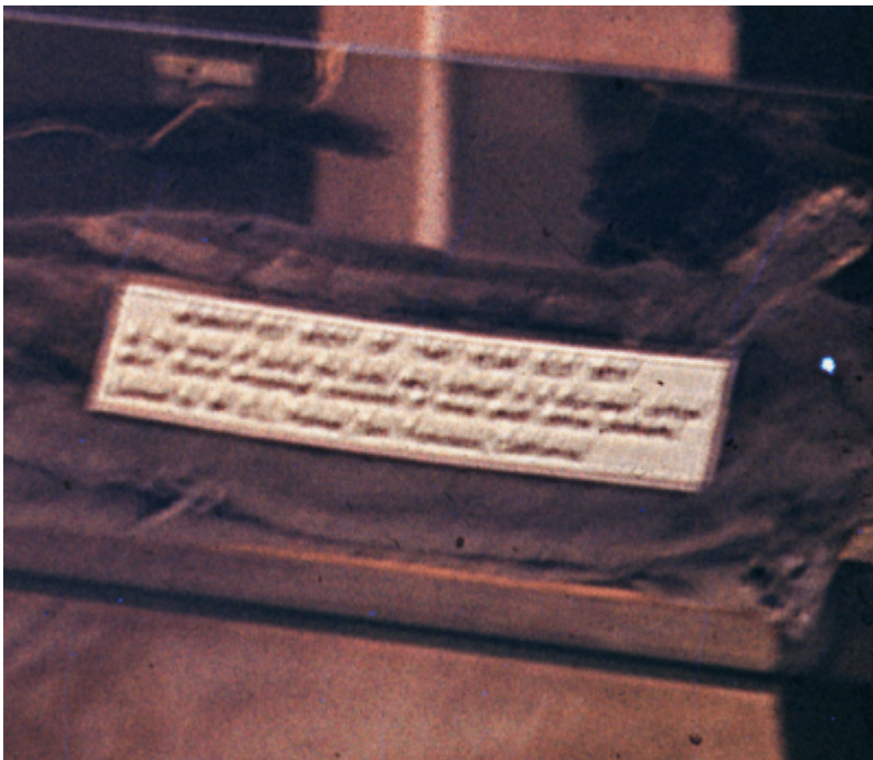
La nuova diapositiva in cui le scritte sono piu' evidenti