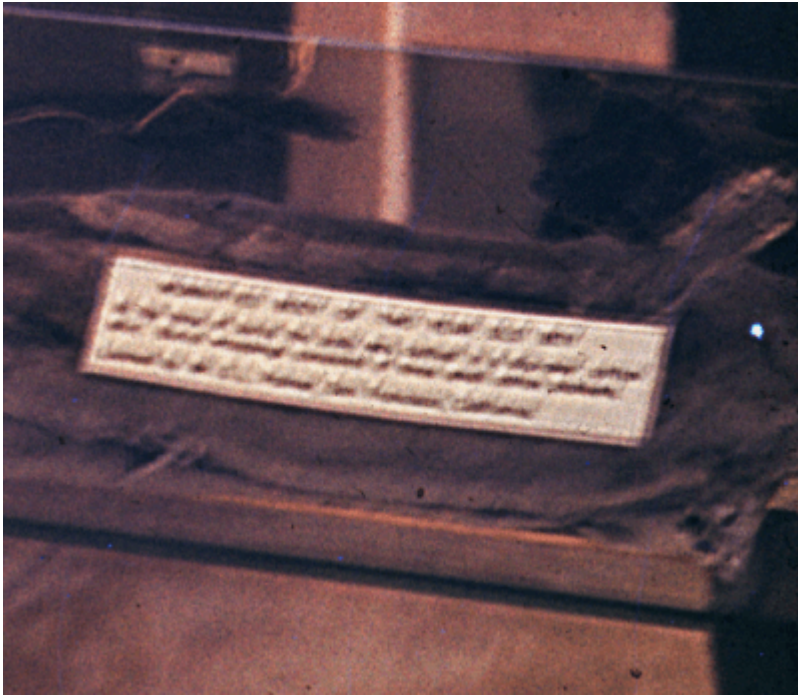
La nuova diapositiva in cui le scritte sono piu' evidenti