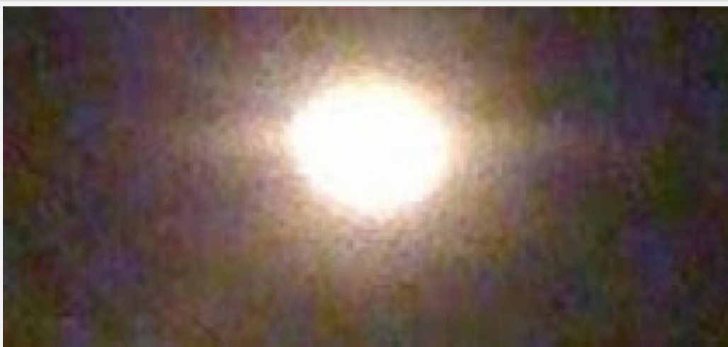
Il "Sole Di Casapulla"

(vedasi la pagina ufo a Casapulla) ho notato interessanti elementi: come è palese dalle immagini sopra il disco solare di Medjugorje e' simile al disco che ho avvistato a Casapulla, da cui mi domando: ho assistito anch'io a Casapulla al miracolo del sole? non credo di meritare questo dono, di conseguenza possiamo chiederci se a Medjugorje si assiste al miracolo del sole o ad altro, a voi le risposte