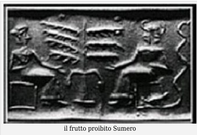
il frutto proibito Sumero

Il mito del frutto proibito : è rappresentato similmente in un cilindro sumero che mostra la scena della tentazione chiamata appunto 'Cilindro della tentazione' .