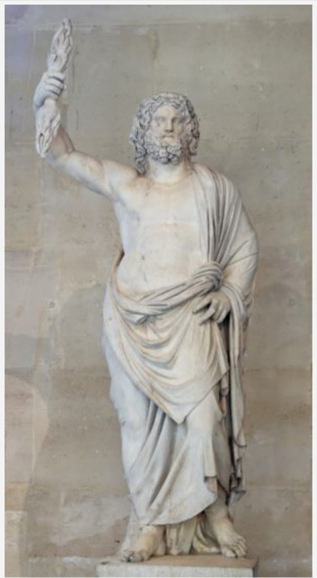
Zeus simil enlil

A questo punto la mitologia o religione ebraica fa un ulteriore passo in avanti : trasforma le divinità di El/En.lil e quelle ad esso collegate ,in unico Dio: “ Yahweh ” il dio biblico quello adorato anche dai cristiani il fatto che Yahweh sia in realta' El/En.lil e' provato dalla Tanakh ebraica ( chiamata comunemente bibbia ebraica che fra l'altro corrisponde quasi all'antico testamento ), dove numerose volte per indicare il dio ebraico Yahweh si utilizza il nome EL (quindi En.lil) . Inoltre il fatto che Yahweh sia in realta' EL/En.lil e' dimostrato da un passo dell'esodo dove Yahweh pronuncia a Mosè: “ Ad Abramo e Isacco mi presentai come El Shaddai [...] ma il mio nome Jahweh, loro non conobbero ” del resto e' risaputo che in epoca Abramitica , DIO era conosciuto con il termine El Shaddai . Per qualcuno il termine El Shaddai significa dio onnipotente , per qualcun'altro dio