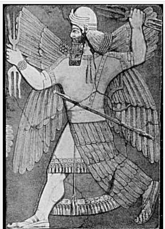
Enlil simile Zeus